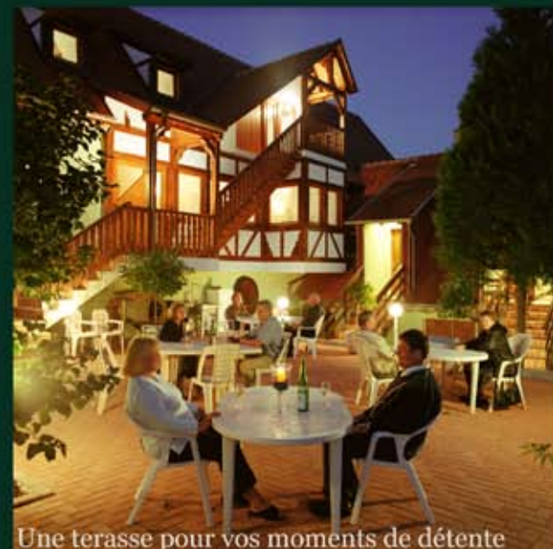
Une terrasse pour vos moments de détente

Aux pieds des Vosges sur la Route des Vins, dans un cadre magnifique avec vue sur le Haut-Koenigsbourg nos locations de charme.